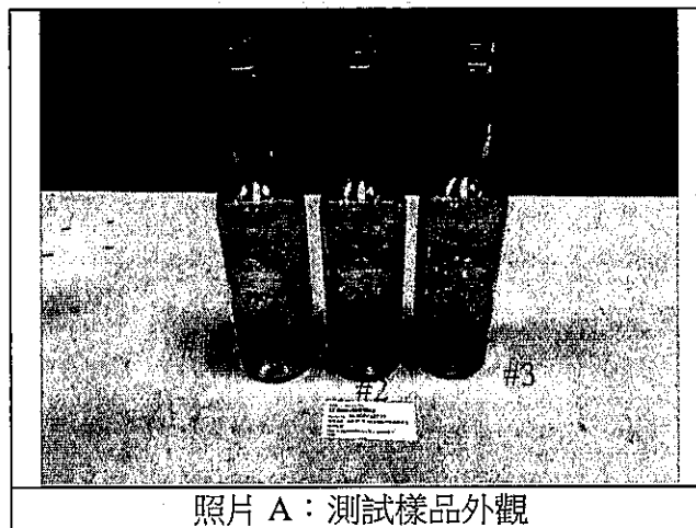
照片 A：測試樣品外觀